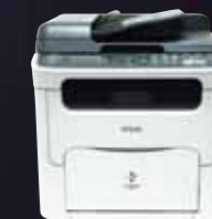
AcuLaser CX16NF Multifonction laser couleur 4 en 1 Réseau