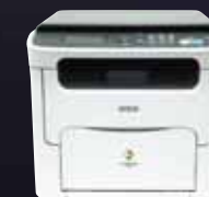
AcuLaser CX16 Multifonction laser couleur 3 en 1