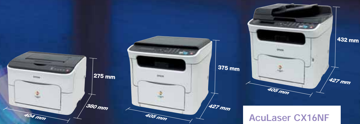
AcuLaser C1600 C11CB04001