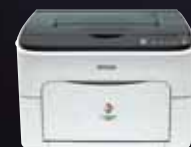
AcuLaser C1600 Imprimante laser couleur